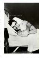
Hemingway, Ernest Hemingway, de la familia de la...

Su mismo asistiendo lo llevó muy temprano a irse de su casa y buscar trabajo como reportero en los periódicos de Kansas City, el famoso City Star. Impulsado a buscar al trabajo por un problema de visión, se unió a la Cruz Roja para poder ir a la Gran Guerra europea.